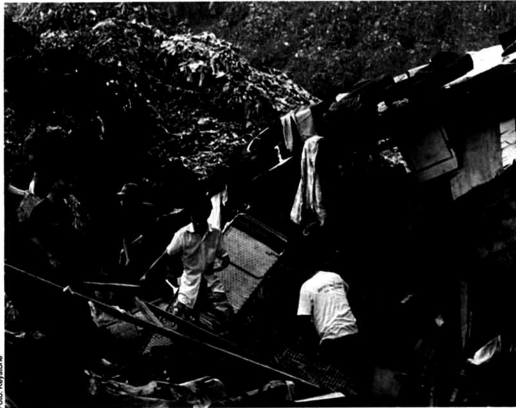
Die Katastrophe: Was man schon lange befürchtete, wurde zur schrecklichen Wirklichkeit. Die grösste Mülldeponie von Manila stürzte ein.